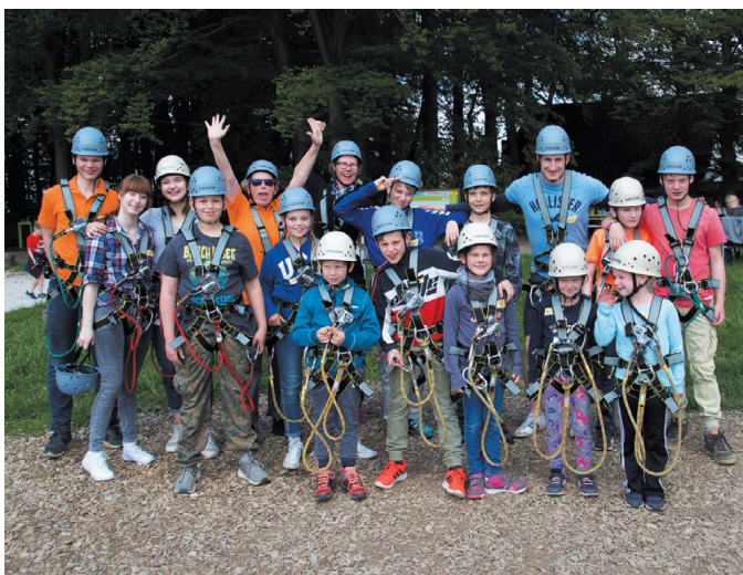
ZuckerLeicht Gruppe im Hochseilgarten K1

Eindrücke von Veranstaltungen der letzten Jahre und aktuelle Termine finden sich auf unserer Homepage www.zuckerleicht.de